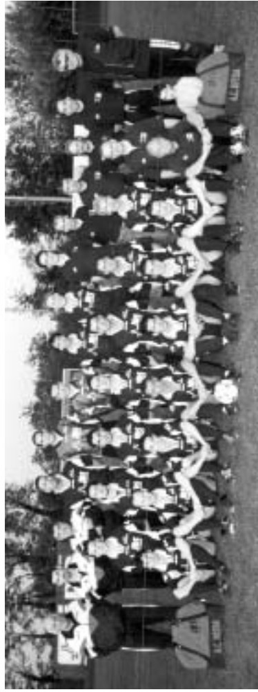
L'A.C. Breda J.D.S.