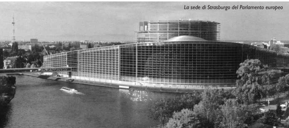
La sede di Strasburgo del Parlamento europeo

Da qui dovremmo ripartire per ricostruire una fiducia nei confronti dell'Unione che se, nei Paesi dell'Est da poco entrati, sembra essere ai minimi termini, tanto consolidata non è neppure nei Paesi che dell'Europa sono stati i fondatori.